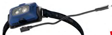
Stirnlampe HF4R Core von Ledlenser