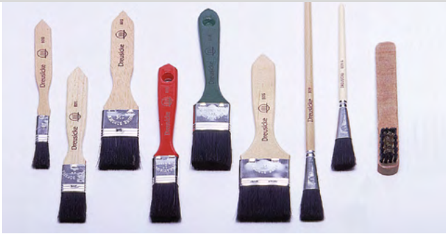
8010 8011 8012 8013 8014 8015 8019 8019-A 8035